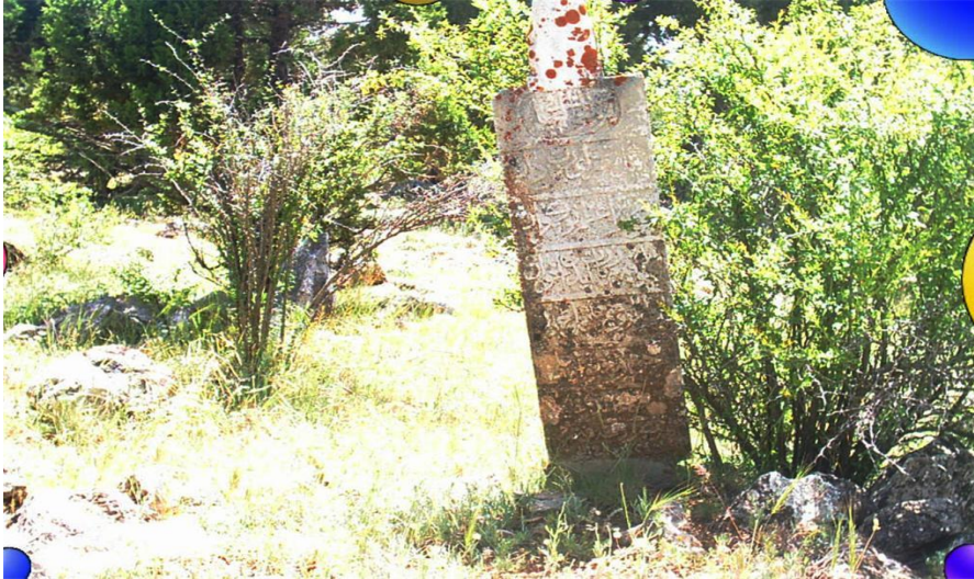
BABA ÖNÜ MEZARLIGINDA ESKİ BİR MEZAR

Avşar,Yazır,Kızık,Çavdır,Bügdüz,Kayı,Kayıcık,Bayındır,Yuva,Yüreğir,Dodurga ,Eymür,Bayat , Çepni Kargın gibi boy adlarını taşıyan yerlerinin sıklığı bizde , düşman saldırısına karşı koyabilmek için yan yana kurularak, karşı bir set oluşturma gayretlerinin olduğu yargısına ulaştırmaktadır. Bizans ile yapılan mücadele oldukça şiddetli geçmiştir. Çevrede yapılan savaşlarda şehitler verilmiştir. Şehit mezarlarını dağlarda ,yaylalarda görebiliriz.. Bu tip bir mezarlık Anbarcık Köyü yaylası ile Kızıllar yaylası arasında bulunan Baba Önü'ndedir. Mezarlığın ilk önce fetih yıllarında şehit düşen veya düşmanla yapılan savaşlar da büyük yararlıklar gösteren Gazi bir eren ve onun yoldaşları için kurulduğunu düşünmek mümkündür. Sonraları yayla da meydana gelen ölümler de gömülenler de olmuştur .Nitekim burada en eskisi Hicri 1181(Miladi 1769 ) yılına ait Osmanlı dönemi kitabeli bir kaç mezar taşı görülmektedir .Anlaşılabacağı üzere Baba lakabı Horasan Erenlerinin sıkça kullandığı isimlerdendir. (İlk çalışmalarım sırasında mezarlığı tam bir taramadan geçiremediğim için en eski mezar taşınının 19 Yüzyıl son dönemine ait olduğunu belirtmiştim.Ancak yeniden bir araştırma yapınca burada daha eski tarihli bazı mezar taşlarını tespit ettik.)